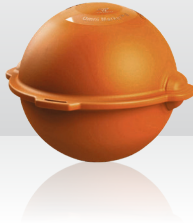
43020006 Kugelmarker OMNIMARKER II