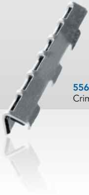
55680109 Crimpspleißschutz KSS1