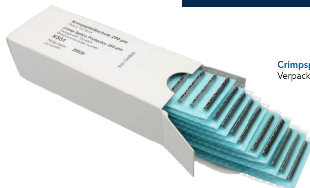
Crimpspleißschutz KSS1 Verpackungseinheit mit 150 Stk.