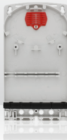
10418994 SDU-Wallbox-SP-S-empty Innenansicht