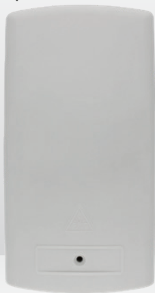
10418994 SDU-Wallbox-SP-S-empty Frontansicht

FTTH-Übergabepunkt für bis zu 4 Adapter/12 Spleiße