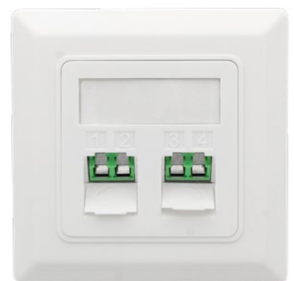
FWO-CS-LC/APC-2 Adapter Zugang geöffnet