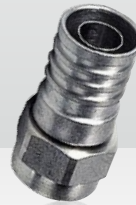
54253000 F-56-ALM 4,9/8,4