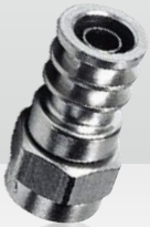
54246100 F-59-ALM 3,7/6,4