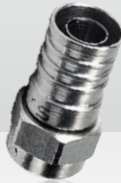
54248500 F-56-ALM 5,1/8,4